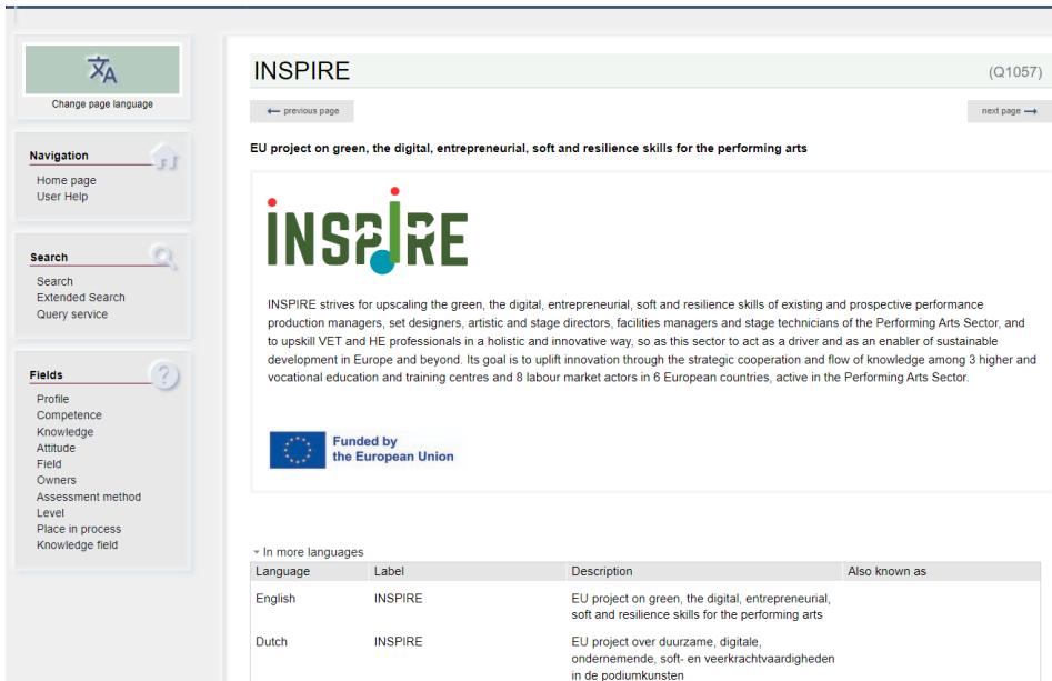
Εικόνα 1 INSPIRE Σελίδα Ιδιοκτήτη

Η σελίδα του ιδιοκτήτη δείχνει το περιεχόμενο που αναπτύσσεται από το έργο. Επί του παρόντος, περιέχει τα προτεινόμενα προφίλ, τις ικανότητες και τις γνώσεις. Θα επεκταθεί κατά τη διάρκεια του υπόλοιπου έργου με τα αποτελέσματα των ενοτήτων και το περιεχόμενο που αναπτύχθηκε.